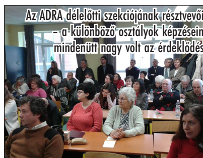
Az ADRA délelőtti szekciójának résztvevői - a különböző osztályok képzésén mindenütt nagy volt az érdeklődés