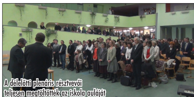
A délelőtti plenáris résztvevői teljesen megtöltötték az iskola auláját