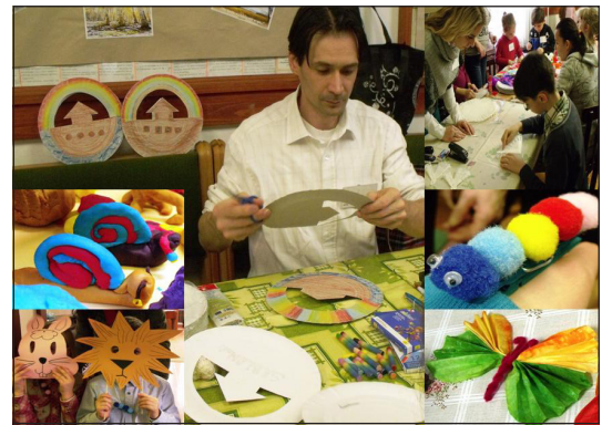
Kézműves ötletek bárkára és állatokra

Ezt követően egy beszélgetéssel tarkított hála vacsorán vehettek részt a családok, ahol finom tésztaféléket fogyaszthattak.