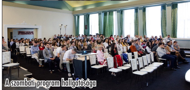
A szombati program hallgatósága