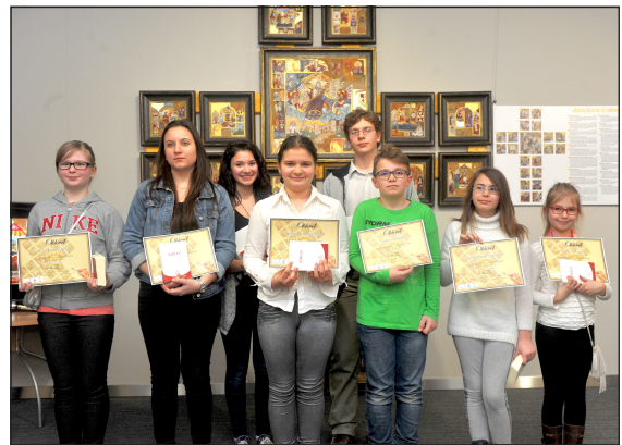
A méltán büszke és boldog szakmai díjazottak

5–8. osztály, középiskolások) hirdettük meg „Jézus élete 21 képen” címmel. Szolnokon valamennyi oktatási intézményt, általános és középiskolát, valamint könyvtárat személyesen kerestünk fel a rajzpályázat plakátjaival és szórólapjaival. A szomszédos településeken is elértünk