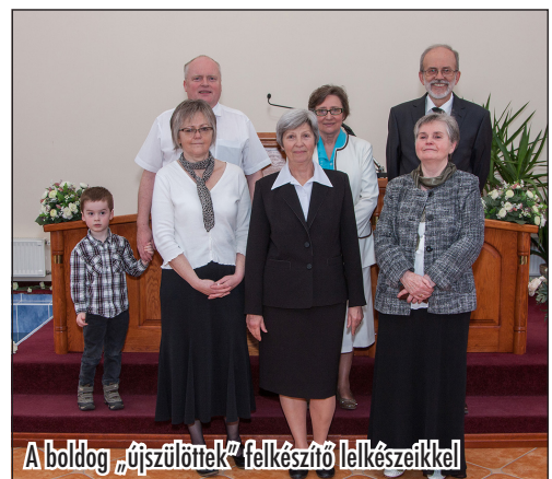
A boldog „újszülötnek” felkészítő lelkészeikkel

Hálás köszönetünk a Lovasberényi Gyülekezet tagjainak! Nemcsak azért, mert úgy gazdagították az ünnepélyt programjaikkal, mintha a saját gyülekezetük növekedéséről lenne szó, hanem azért is, mert minden vendéggel rendkívüli udvariassággal és szeretettel foglalkoztak, és mindenkit megvendégeltek a szertartás