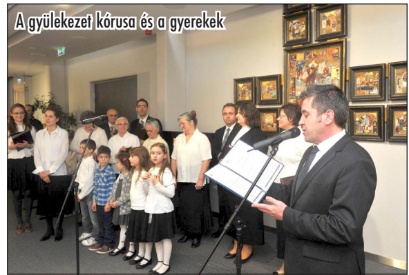
A gyülekezet kórusa és a gyerekek

A programsorozat nemcsak arra volt jó, hogy megismertesse a Hetednap Adventista Egyházat Szolnok lakossága körében, hanem a gyülekezeti közösséget is jobban összekovácsolta azáltal, hogy közösen készültünk a különböző alkalmakra.