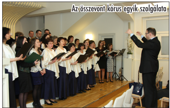
Az összevont kórus egyik szolgálata