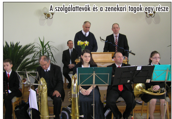
A szolgáltatók és a zenekari tagok egy része

A délutáni órát követően kimentünk a belváros egyik terére. Itt is éreztük a jó Isten segítségét, mert a kedvezőtlen időjárás ellenére az arra járókat finom süteménnyel kínálhattuk, és könyveket, folyóiratokat is ajándékoztunk nekik, melyeket szívesen fogadtak a gyönyörű zenei szolgálat mellett. Ezúton is szeretnénk megköszönni mindkét