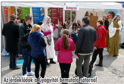
Az érdeklődők a Gyógyító bemutató sátnál