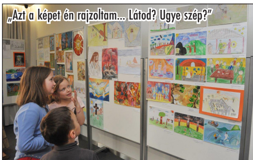
„Az a képet én rajzoltam... Látod? Ugye szép?”