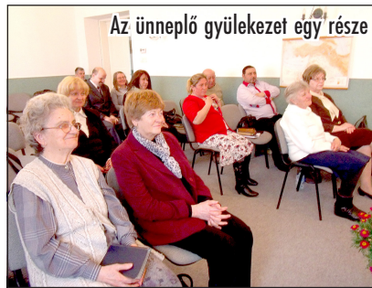
Az ünneplő gyülekezet egy része

A közös ebéd után a csoport nagy része délutánra is maradt, és mindannyian