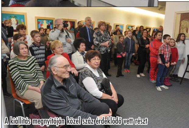
A kiállítás megnyitóján közel száz érdeklődő vett részt

néhány általános iskolát, így végül több mint 30 intézménnyel kerültünk kapcsolatba. Isten különleges munkáját és áldását tapasztaltuk, mivel összesen 100 pályázótól kaptunk szebbnél szebb műveket, melyeket szintén kiállítottunk. Valamennyi pályázó névre szóló emléklapot kapott, illetve egy Bibliát. A pályázó intézmények is kaptak emléklapot, a legtöbb alkotást és díjazott pályázatot beküldő iskola pedig díszoklevelet is.