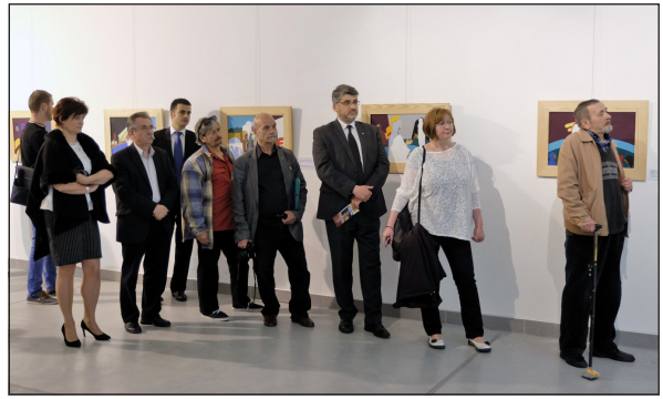
A gyulai Jézus élete kiállítás résztvevőinek egy csoportja az ünnepélyes megnyitón

A program része az iskolákban meghirdetett rajzpályázat, melynek keretében a gyerekek Jézus életének különböző mozzanatairól rajzolhatnak, festhetnek. Az első helyezettek munkái a vándorkiállítás végén