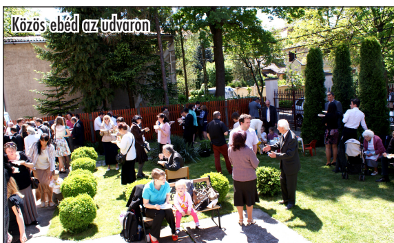
Közös ebéd az udvaron