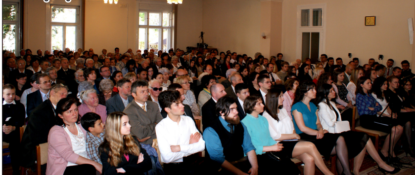
Az Apáczai Csere János utcai kápolna (Miskolc „A”) zsúfolásig megtelt imaterme