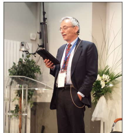
Clifford Goldstein, a Bibliatanulmányok főszerkesztője előadását tartja

Az imádat és a dicsőítés Isten ajándéka, ahogyan Pál apostol is megfogalmazta