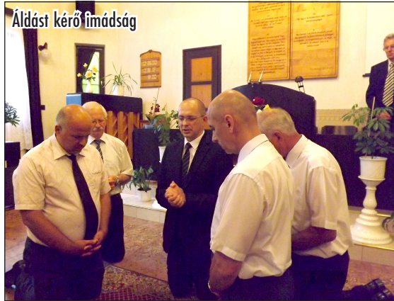
Áldást kérő fimádság

A nagy létszámú gyülekezetek életében kiemelt jelentősége van annak, hogy megfelelő számú helyi tisztségviselő forgolódjon az evangélium szolgálatában. Ezért mindig örvendetes, amikor a gyülekezetben helyi vezetőket, presbitereket iktathatunk be a szolgálatba.