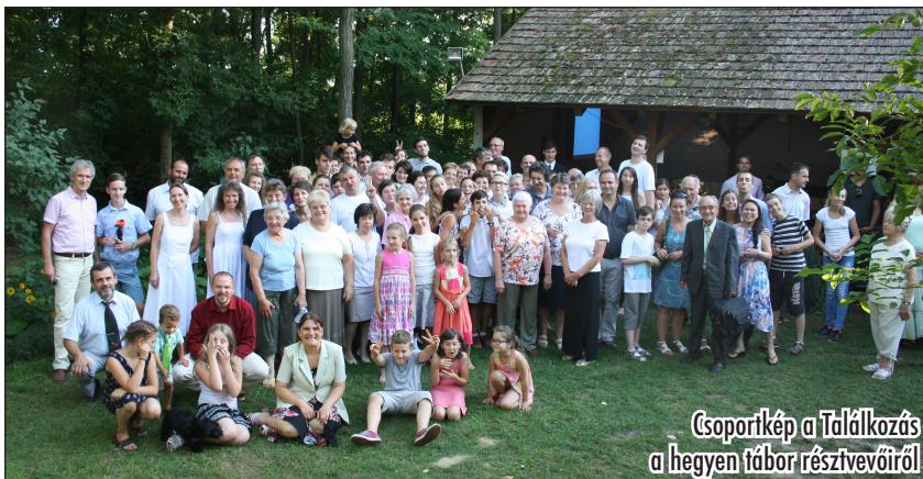
Csoportkép a Találkozás a hegyen tábor résztvevőiről