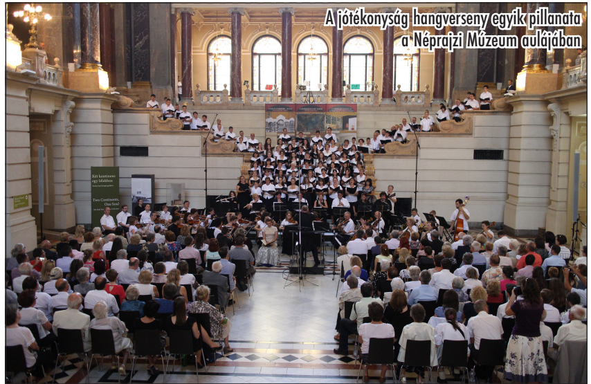
A jótékony hangverseny egyik pillanata a Néprajzi Múzeum aulájában

A tábor végén két koncertet tartottunk. Az egyiket Pálházán, ahol mintegy 90-en, a