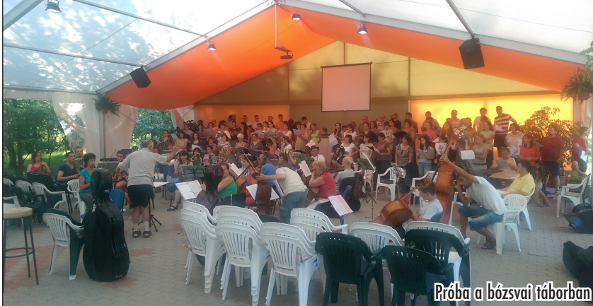
Próba a bózsvai táborban