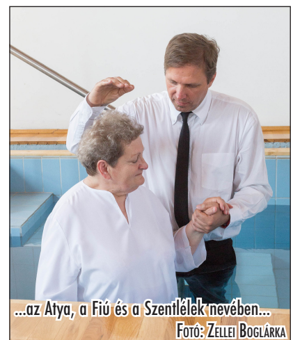
...az Atya, a Fiú és a Szentlélek nevében...