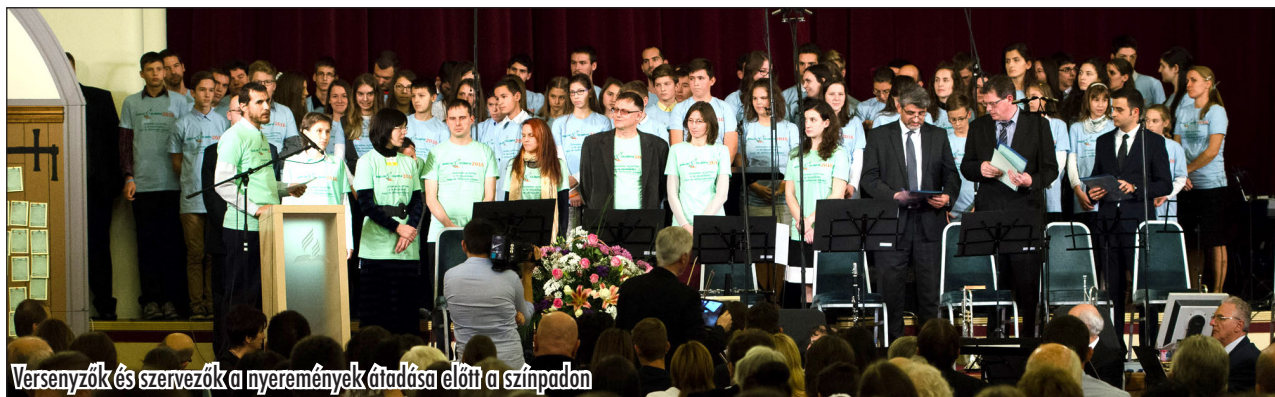
Versenyzők és szervezők a nyeremények átadása előtt a színpadon