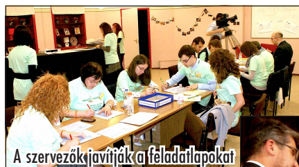
A szervezők javítják a feladatlapokat