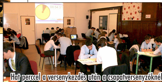
Hat perccel a versenykezdés után a csapatversenyzőknél