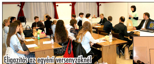
Eligazítás az egyéni versenyzőknél

Az elsőként végeztek táborozási kedvezményekkel, a valenciai ifjúsági találkozón való részvétel lehetőségével, illetve a földijjal – egy Szentföldi zárandokúttal – gazdagodtak. Őket kérdeztük, hogyan és mit pakoltak be „lelki hátizsájkukba”, miként érezték magukat a megmérettetések során, és mit tanácsolnak azoknak, akik 2017-ben szeretnék csatlakozni a bibliai olimpiakonok csapatába: