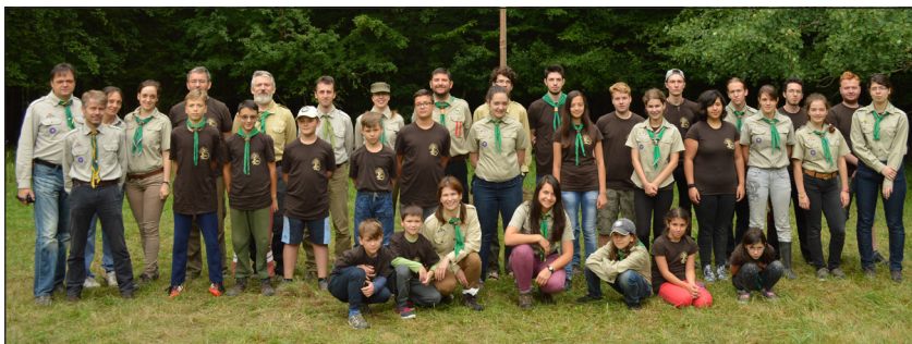
A Michnay László Cserkészcsapat 2016. évi csapattáborában készült csoportkép