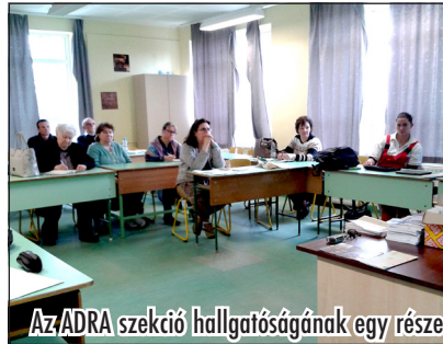
Az ADRA szekció hallgatóságának egy része

Szó volt az ADRA tábor lényegéről, fontosságáról, hiszen a fentebb említett nehéz sorsú gyermekek és fiatalok, valamint a mélyszegénységben élők, soha