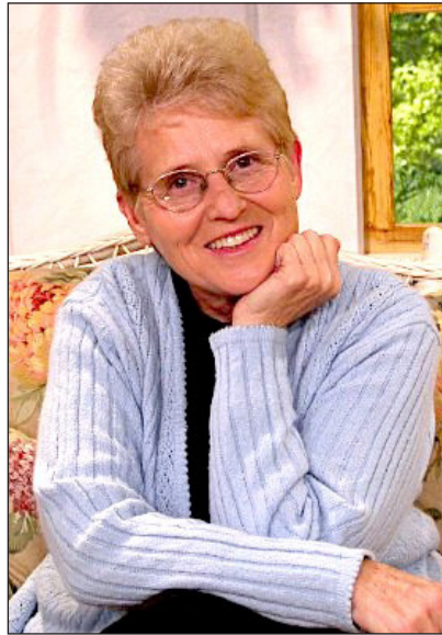
Kay Kuzma testvérnő, ismert és elismert gyermekpszichológus és családterapeuta

„Az első 7 év” kiadására egy pszichológus testvérünk vállalkozott. A kötet 2013-ban jelent meg a VitaPlaza Kft-nél, magánkiadásban. Az Advent Kiadónak annyi köze van a kiadványhoz, hogy több tucatot átvettünk forgalmazásra, tekintettel a szerzőre és a könyv nemzetközi sikerére. Miről is szól? Bizonyos, hogy közel 700 oldalnyi tartalmával és 3000 Ft-os árával nem könnyű beszerezni minden családnak, ahová beköszönt a gyermekáldás, de nagyon hasznos lenne. Tudniillik nemcsak