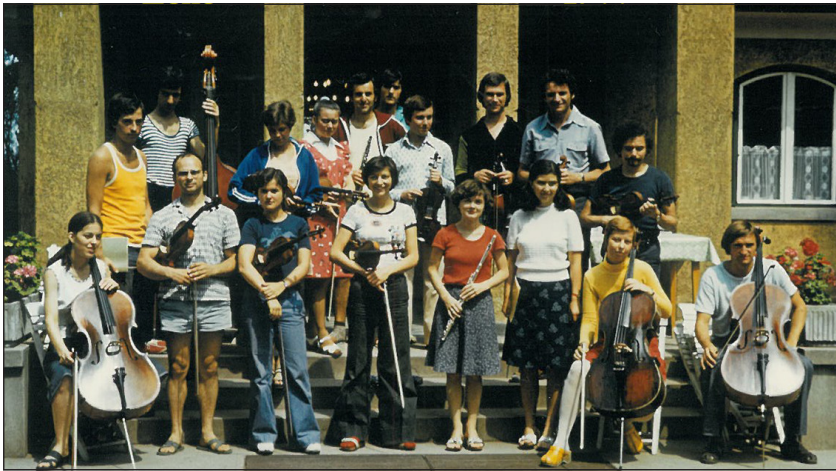
Az Advent Kamarazenekar tagjai Balatonlellén 1977-ben