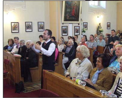
Szolgálat a vizsolyi katolikus templomban

Vegyes és Férfikar Isten előtti áhítatra és mély hódolatra nyitotta meg az istentiszteleten résztvevők szívét. Hála és köszönet érte! Ami kijár