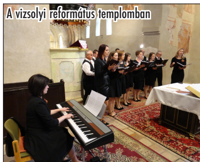
A vizsolyi református templomban

Mostani kirándulásunk a reformáció 500. évfordulója jegyében történt. A „Vizsolyi dalos templomtúrán” a római katolikus és a református templom évszázados