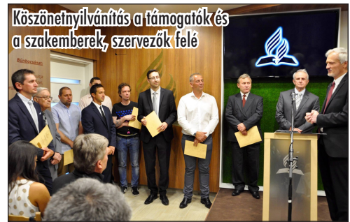
Köszönetnyilvánítás a támogatók és a szakemberek, szervezők felé

Az istentisztelet első részében köszönetet mondtunk a támogatóknak, és megköszöntük az építkezésben tevékenykedő szakemberek és szervezők önfeláldozó munkáját.