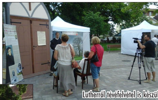
Lutherről tévéfelvétel is készül

eseményről. Némely látogató megkérdezte: Honnan jöttek? Nem volt könnyű a válasz, hogy valaki ki ne maradjon. A felelet valahogy így hangzott: Cegléd, Baja, Kecskemét, Kiskunhalas, Soltvadkert, Dunaújváros, Kiskőrös... és egyéb helyekről.