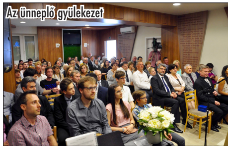
Az ünnepelő gyülekezet