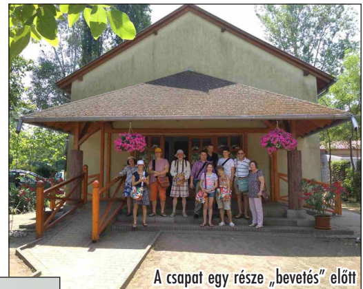
A csapat egy része „bevetés” előtt

standunkat. Ennek a helynek az érdekessége volt, hogy noha nagyon forgalmas helyen kaptunk könyvadásra területet, a hajóra igyekvő emberekkel utazó gyerekek érdeklődése volt a nagyobb a könyveink iránt. Közben azért kialakultak nagyon mély, komoly beszélgetések több értékes emberrel.