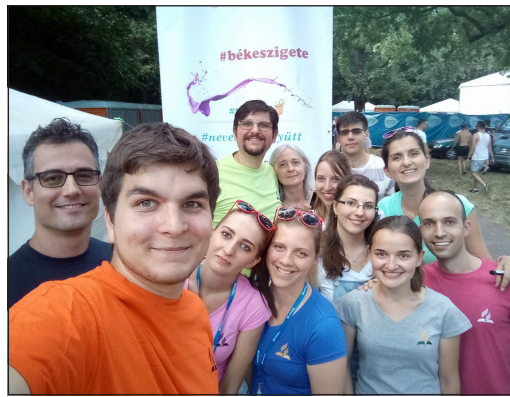
Fent: Szerdai csapatunk bevetésre készen!

Mi a fesztivál egyik kis oldalösvénye mellett sátraztunk a rockaréna folyamatos hangorkánjától kísérve. De ezen a keskeny ösvényen mégis ezek haladtak el, és közülük több mint ezer látogatóval kerültünk kapcsolatba, akik letértek a széles útról, gyakran csak azért, mert az adventistákat keresték. Egy fesztiválon. Ugye, milyen csodálatos?