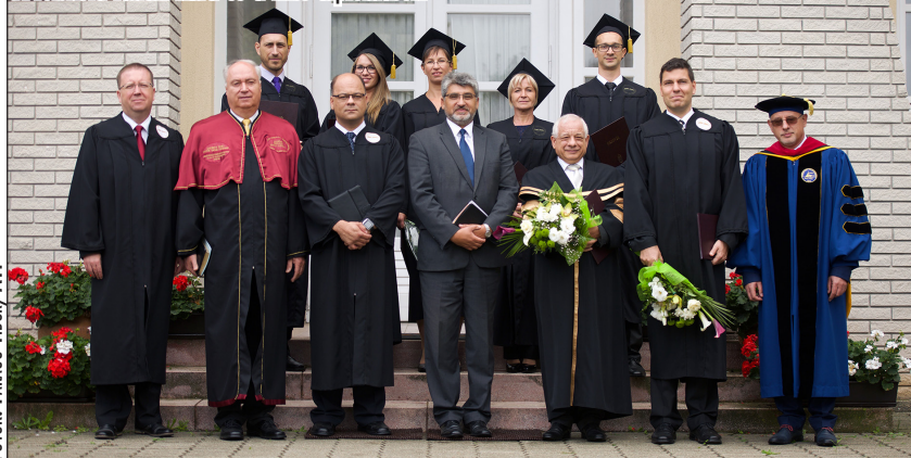
A főiskola tanári kara és a friss diplomások