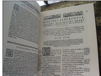
A Biblia egy részlete