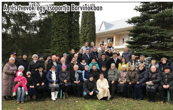
A résztvevők egy csoportja Barvinokban