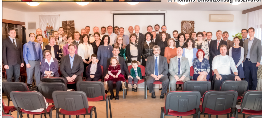
A Plenáris Unióbizottság résztvevői