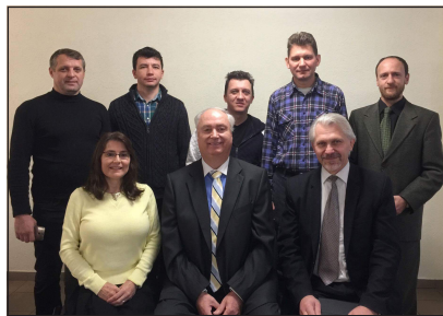
Az egyházterület elnökével és a lelkészekkel