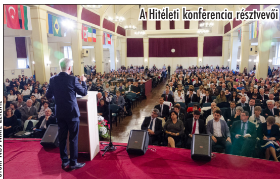
A Hitéleti konferencia résztvevői