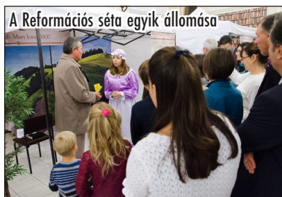
A Reformációs séta egyik állomása