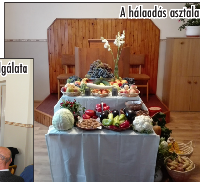
A hálaadás asztala

Ezt követő szombaton, szeptember 30-án idősek napja ünnepélyünkre a józsi kórust hívtuk meg vendégszolgálatra. A sok, drága fiatal testvérünk fogadásánál szívünk nagy boldogsággal telt meg. Az igehirdetést Szöllősi Árpád testvér végezte. A kórus szolgálatát fele-