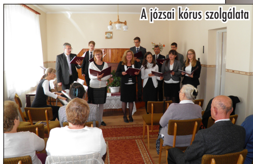
A józsi kórus szolgálata