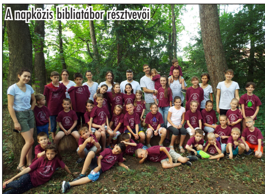
A napközis bibliatábor résztvevői