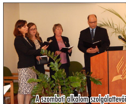
A szombati alkalom szolgálattevői

Láthattuk, és hallhattuk, Isten hogyan gondoskodott arról, hogy a Biblia magyar nyelven, az akkori ember kezébe kerüljön, a nagy Magyarország egész területén.