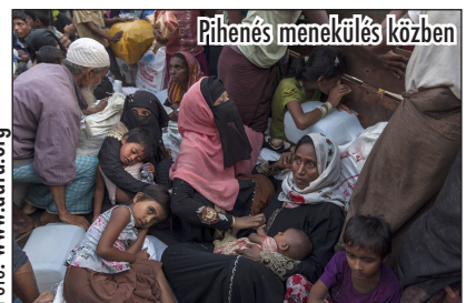
Pihenés menekülés közben