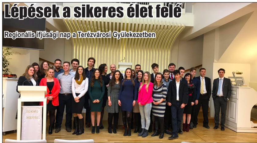
Február 24-én Regionális ifjúsági nap volt a Székely Bertalan utcai, központi gyülekezetben. A felemelő, közös énekek, a fiatalok szolgálata segítette a résztvevő-

ket különös módon megtapasztalni Isten jelenlétét, Isten imádatának örömét.