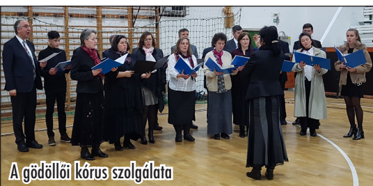
A gödöllői kórus szolgálata

A REK és a Reménység TV – akiknek ezúton is köszönetet mondunk áldozatos szolgálataukért – által készített hang- és videofelvételek szerkesztett formában nemsokára elérhetőek lesznek a dunabibliakonferencia.hu honlapon. Vágatlan formában pedig a videó jelenleg is elérhető a DET Facebook oldalán (fb.cob/hnadet).