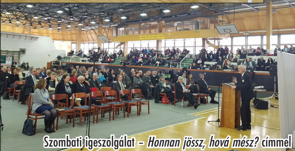
Szombati igeszolgálat – Honnan jössz, hová mész? címmel