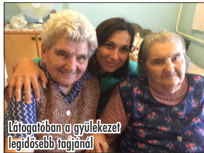
Látogatóban a gyülekezet legidősebb tagjánál

A délután folyamán sok információt tudtunk meg a Debrecenben működő Reménypont Közösségi Iroda missziós tevékenységéről. Önkéntes fiatalok segítségé-