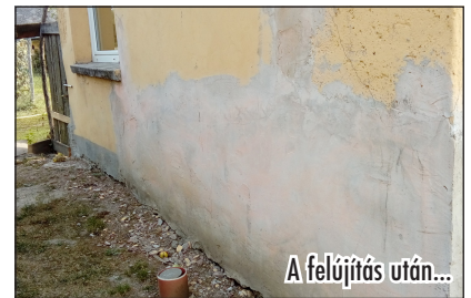
A felújítás után...

A magyar ADRA Szeretetszolgálat Alapítvány ezúton is megköszöni a támogató testvéreknek a tizedcedulán is feltüntetett, folyamatosan beküldött adományt. Segíts te is, hogy mi is gyorsan, hatékonyan segíthessünk rászoruló embertársainkon!