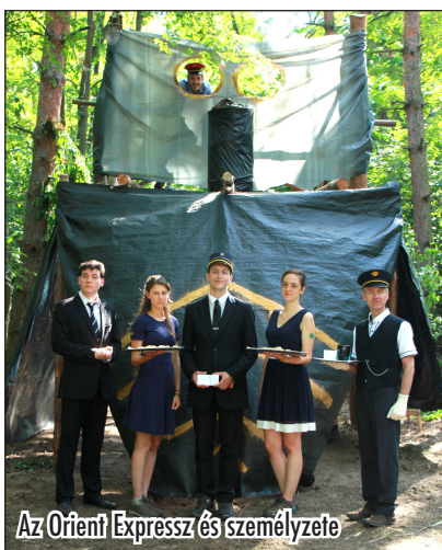
Az Orient Expressz és személyzete