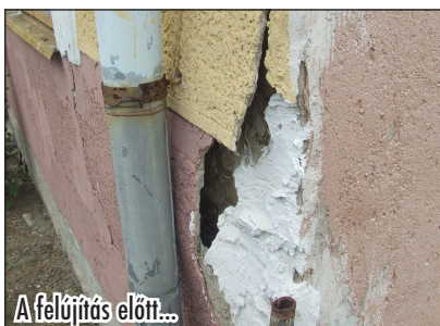
A felújítás előtt...