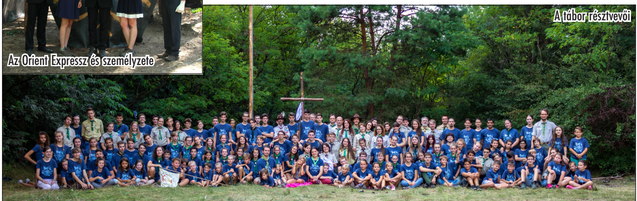
A tábor résztvevői