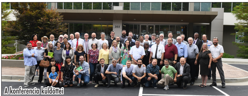
A konferencia küldöttei