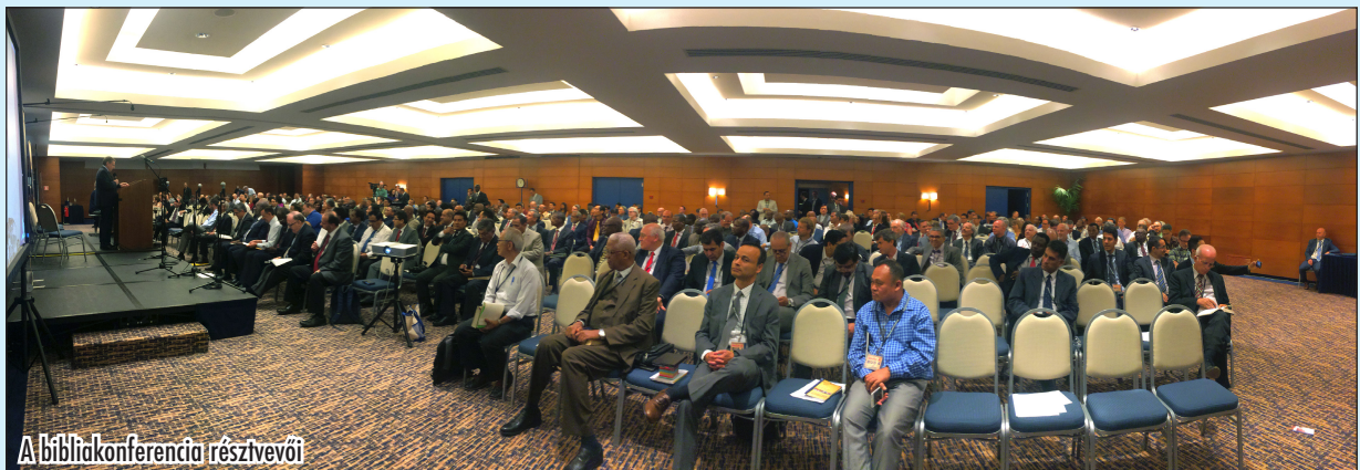
A bibliakonferencia résztvevői