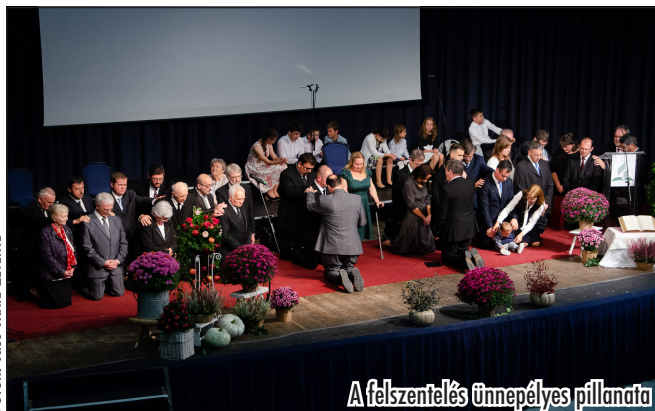
A felszentelés ünnepélyes pillanata

Ahogy egyikük megfogalmazta, számára ez az esemény egy hosszú út végét jelentette, ami visszatérés és rehabilitáció is egyben. Jó volt látni, hogy a lelkészi fogadalmat nemcsak a felszentelt prédikátorok, hanem velük együtt a feleségek is megtették, mert ők ketten végzik közösen, csapatként ezt a hivatást.