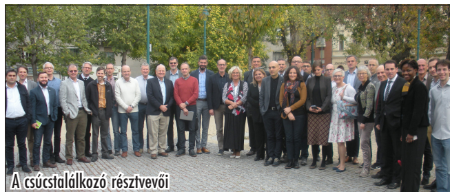
A csúcstalálkozó résztvevői

A rendezvény folyamán lehetőség volt a kapcsolatépítésre is, így szóbeli megállapo-