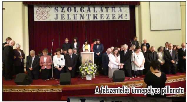
A felszentelés ünnepélyes pillanata