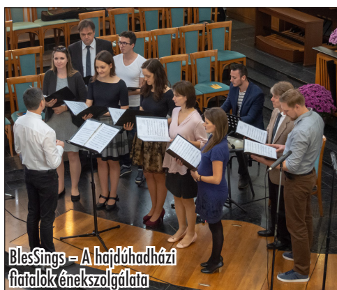
BlesSings – A hajdúhadházi fiatalok énekszolgálat

Az országos Ifjúsági Szombatiskolai Konferencia a Szombatiskolai Osztály és az Ifjúsági Szolgálatok Osztálya közös szervezésében november 3-án Debrecenben került megrendezésre. A hajdúhadházi BlesSings énekegyüttes szolgálatának köszönhetően a felemelő zene, Isten dicsőítése sem hiányzott. A konferencia célja, hogy rámutasson a bibliatanulmányozás és a szombatiskola fontosságára az Istennel való kapcsolatunk tekintetében. Helyesen tervezve és vezetve a Bibliatanulmány áldás lehet minden korsztály számára.