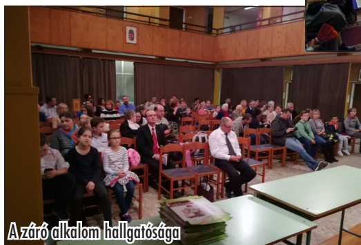
A záró alkalom hallgatósága