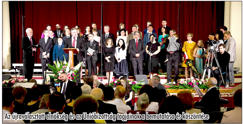
Az újraválasztott elnökség és az Unióbizottság tagjainak a bemutatása és köszöntése