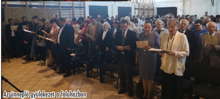
Az ünneplő gyülekezet a faluházban