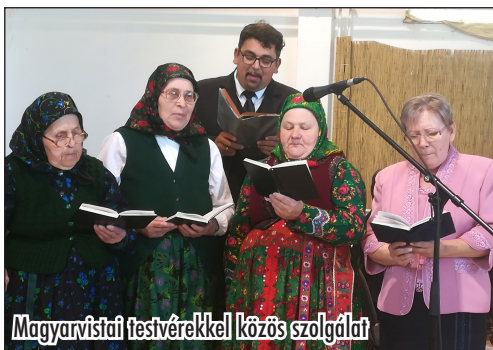
Magyarvistarai testvérekkel közös szolgálat