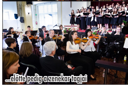
...előtte pedig a zenekar tagjai