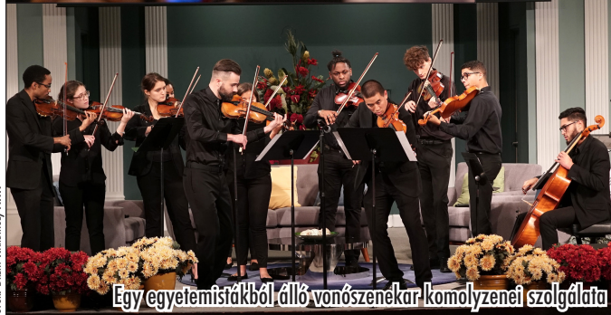
Egy egyetemistákból álló vonózenekar komolyzenei szolgálata