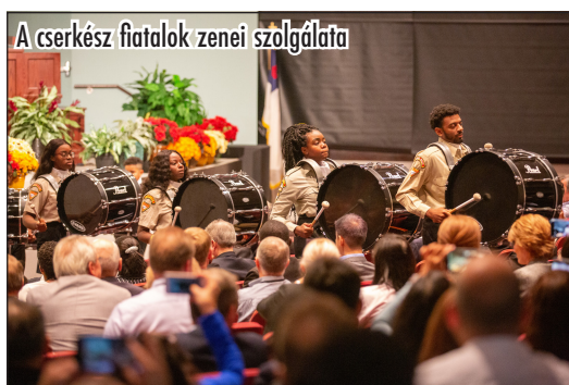
A cserkész fiatalok zenei szolgálata