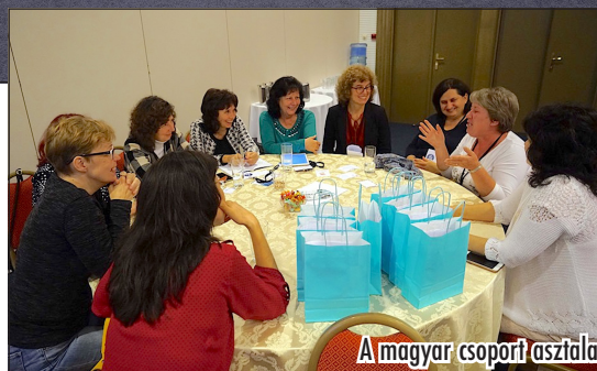
A magyar csoport asztala

Az óváros szűk utcái a középkor hangulatát idézték. Visszarepültünk az időben és elképzeltük, hogyan is éltek az emberek akkor. A sok színes ház, a macskaköves utcák és a mosolygós helyiek vidámmá tették a napunkat, főleg, mert az idő is