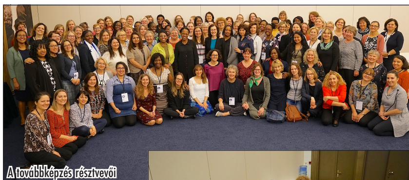
A továbbképzés résztvevői

Lelkesítő volt a felismerés, hogy amikor elhangzott: „Teremtsünk embert a mi képünkre...”, ez az Atya, a Fiú és a Szentlélek együttes döntése volt. Nem volt, és azóta sincs alá-fölrendeltség közöttük. Ha az emberpár Isten képmását tükrözi, nem lehet másképpen velünk sem. Ádám és Éva Isten kezéből kikerülve tökéletes egységben és egyenrangú személyként éltek meg a házasságukban a szerepüket. A feladatköröket természetesen adottságaik és képességeik szerint felosztották, ahogy ez ma is kívánatos.