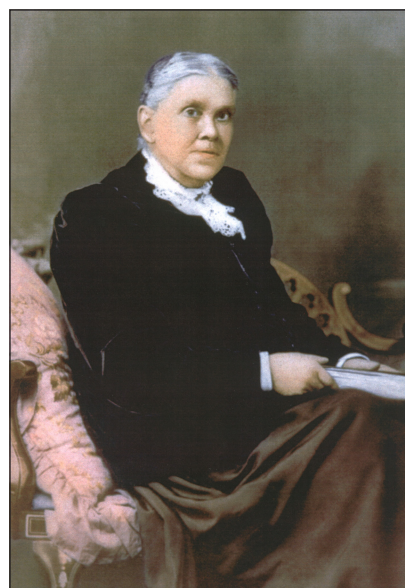
Egy festmény Ellen G. White-ról. Készült Ausztráliában 1899 körül

2) Ellen White tovább folytatta a munkát az otthonában. Időkeretet határozott meg, hogy elérje a kitűzött céljait. Arról számol be, hogy nem hagyta ki a napi mennyiség leírását. Ez is hasznos, ugyanis erősíti a küldetésstudatunkat. Összpontosítanunk kell, meg kell találnunk a módját, hogy a célunkat elérjük, még a karantén