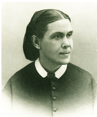
Ellen G. White

Mégis a prófétai szó a nagy küzdelem forgatagában nem a leggyakrabban keresett hang, sőt a 21. századra a bennünket körülvevő általános kultúra egyre lejjebb akarja nyomni Isten üzenetét. Tanulj, építsd a karriered, dolgozz, légy tájékozott a világ dolgaiban, használd ki a szabadidőd minden másodpercét az élvezetredre – sugallja minden körülöttünk, és folytathatnánk a sort. Nem rossz dolgok ezek, csak egyre nagyobb részt követelnek a figyelmünkől, már-már annyira, hogy ne maradjon energiánk Isten dolgaira.