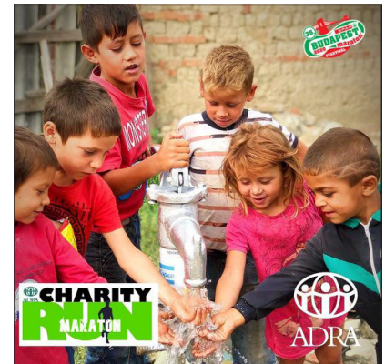
A gyerekek örülnek a közeli kútnak

Közel 100 000 embertársunk él olyan településeken a határaink közelében, ahol még nem megoldott az ivóvíz-ellátás. Nincs csatornázás, sem vezetékes víz, a vízforrásul szolgáló kutak is többnyire kívül esnek az adott környéken, tehát a helyiek adott esetben több száz méterről kénytelenek a vizet hordani.