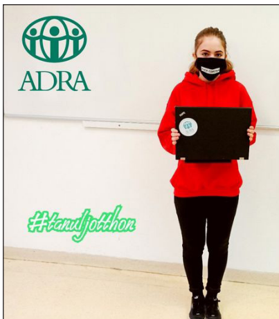
A #tanuljotthon program egyik kedvezményezettje