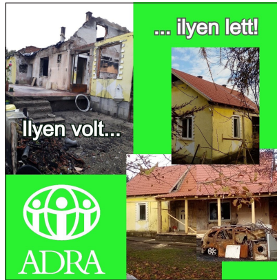
A kovácsvágási háztető felújítása

„Ami akartok azért, hogy az emberek tiveletek cselekedjenek, mindazt ti is úgy