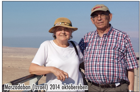
Maszadában (Izrael) 2014 októberében

– Látszólag ez nem idetartozónak tűnik, és id. Szöllösi Árpád testvér szerint: „akinek nem inge, ne vegye magára, de nem árt, ha felpróbálja”. Szeretnék egy nagyon fontos dolgot megemlíteni. Azt gondolom, hogy aki a szó nemes értelmében lelkesfeleséggé szeretne válni, de annak minden részletében is, lehet, még nincs tisztában ennek a hivatásnak a mélységével, nem tudja, mire vállalkozik. Nem lehet alakoskodni, megjárni a „nagyasszonyt”. Sajnos ezt nem mindenki érzi így, mivel én magam sok „nagyasszonnyal” találkoztam, és sok kiábrándult, kiégett lelkesfeleséget láttam a környezetemben. Hiteles lelkesnek, lelkesfeleségnek lenni nagyon nehéz.