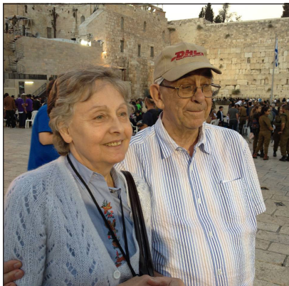
Jeruzsálemben a Siratófalnál, szintén 2014 októberében

– Sosem vittem túlzásba az unokákkal való foglalkozást, igyekeztem nem zavarni a gyermekeim családi életét, amennyiben mégis szükség volt rám, azonnal ott voltam mellettük. Óvodai, iskolai szünetben vittem őket sétálni, játszótérre, kirándulni. Amikor igényelték még