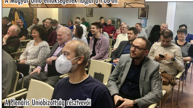
A Plenáris Unióbizottság résztvevői