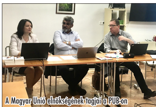
A Magyar Unió elnökségének tagjai a PUB-on