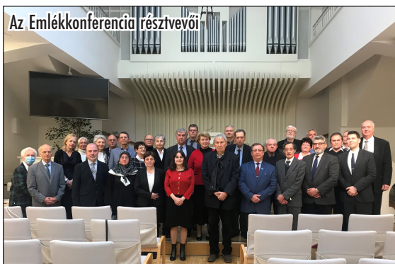
Az Emlékkonferencia résztvevői