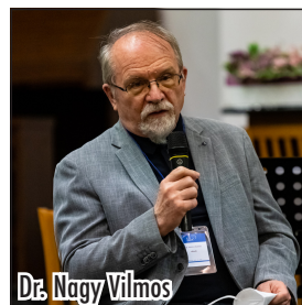
Dr. Nagy Vilmos

Gyakran találkozunk mindennapjaink során különböző kockázatokkal. Az egészségügyben is jelen vannak, így mindig fontos arról tájékozódunk, hogy egy vizsgálat, vagy kezelés milyen kockázatokkal jár, ezek mennyire gyakoriak, vagy éppen súlyosak, és ezeket az információkat a helyükön kell kezelni. Nem érdemes sem felfújni a problémákat, sem alábecsülni a kockázatokat. Fontos azt is figyelembe venni, hogy a vizsgálat vagy kezelés elutasításával hiába zárjuk ki az azokkal járó kisebb kockázatokat, ha közben nagyobb rizikónak tesszük ki magunkat kezelés nélkül. Egy betegséggel járó kockázatokat nem lehet figyelmen kívül hagyni, mert ugyanúgy a döntésünk részei, mint a kezelése kockázatai. Ha nem vagyunk biztosak, hogy mivel nézünk szembe, vagy nem értjük teljesen a kockázatokat, kérdezzünk bátran az orvosunktól, és ő segíteni fog nekünk. Szakemberként ők a legalkalmasabbak arra, hogy számunkra a legerősebben, teljes körű tájékoztatást adjanak az adott problémáról.