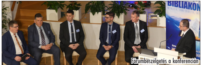
Fórumbeszélgetés a konferencián