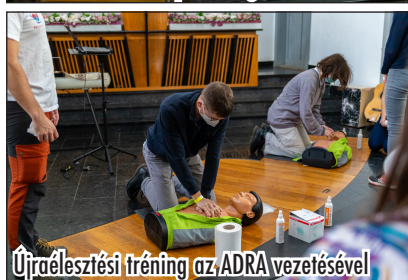
Újraélesztési tréning az ADRA vezetésével