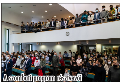
A szombati program résztvevői