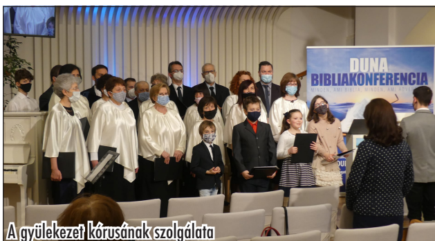
A gyülekezet kórusának szolgálata