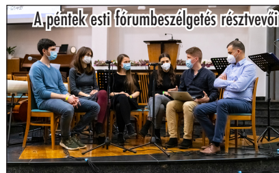
A péntek esti fórumbeszélgetés résztvevői