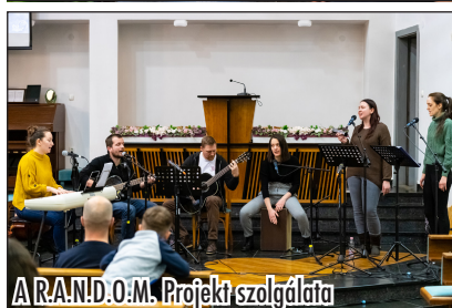
A R.A.N.D.O.M. Projekt szolgálata