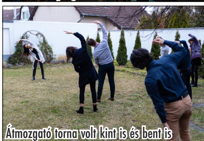
Átmozgató torna volt kint is és bent is