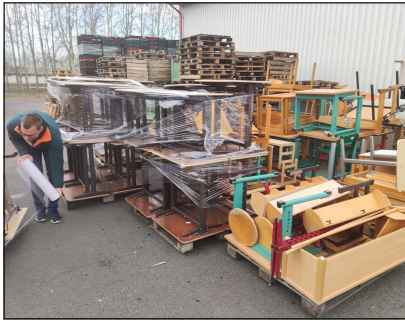
Az iskolabútorok csomagolása, pakolása