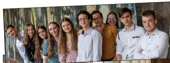
A 316_dicsi_énekegyüttes tagjai (balra)

Változás? ... Miért gyökeres? ... Miért nem inkább látványos? ... Nem az fog változást hozni az életedben, amit te gondolsz magadról, hanem az, amit Isten tervezett!