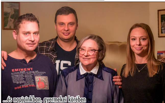
...és napjainkban, gyermekei körében