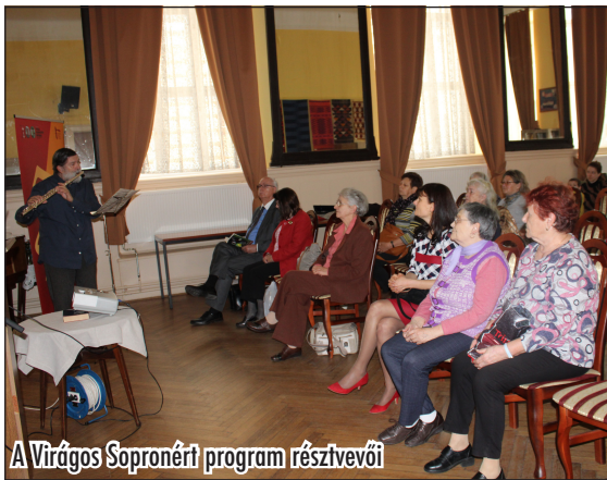
A Virágos Sopronért program résztvevői

A mostani alkalom húsvét előtt, 2022. április 5–14-ig, nyolc napon keresztül tar-