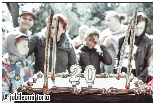
A jubileumi torta

Az ünnepségen a Hetednapos Adventista Egyház