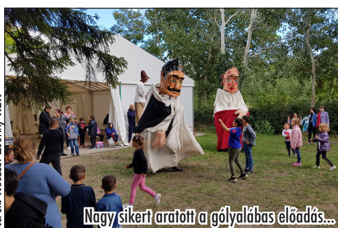
Nagy sikert aratott a gólyalásbas előadás...