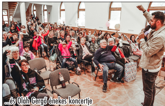
...és Oláh Gergő énekes koncertje