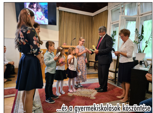
...és a gyermekiskolások köszöntése

Nem maradhatott el azonban a gyermek-szombatiskolai tanévnyitó sem, amely régi hagyomány gyülekezetünk-