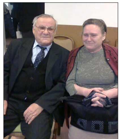
Az Önböli házaspár

– A család helyzete miatt 14 évesen már dolgoznom kellett. A helyi tsz-ben végeztem sokféle munkát, köztük nehéz fizikai munkát az aratásnál, cséplésnél. 16 évesen kévevágó voltam a cséplőgép tetején. Nagyon nehéz munka volt.