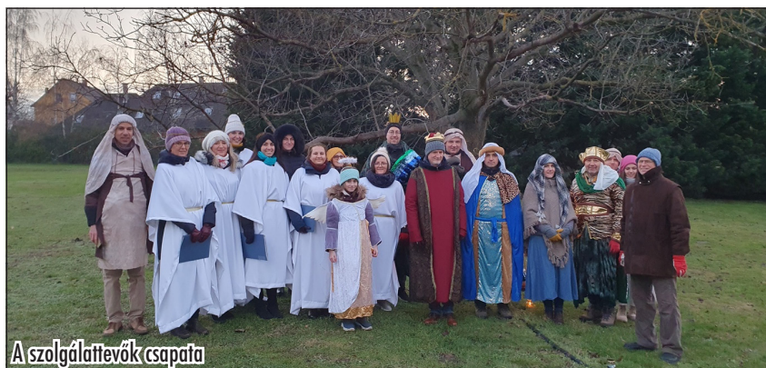
A szolgáltatók csapata