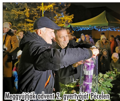
Meggyújtják advent 2. gyertyáját Pécelen

A látogatók egészen bevonódtak a történetbe, ahol a beöltözött szereplőkön és angyali kórusműveken keresztül megismerhették Jézus szüleit, a betlehemi fogadósokat, a távol-keleti bölcseket, a hatalomvágyó Pilátust, az angyalok csodálatos énekeit, és egy igazi kis bárányt; rajtuk keresztül Isten örömhírét tapasztalhatták meg. Ezután közös kézműveskedés, játék, friss pogácsa és forró tea mellett volt lehetőség beszélgetni, kapcsolódni.