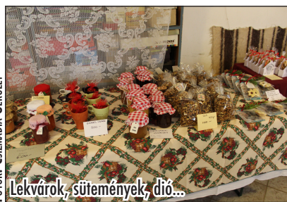
Lekvárok, sütemények, dió...