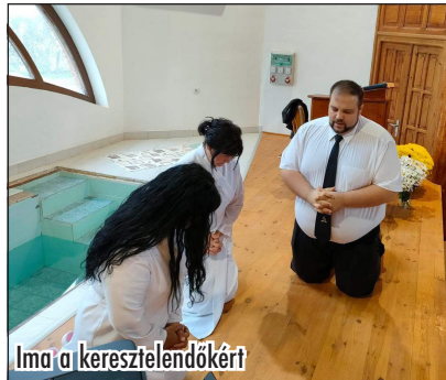
Ima a kereszteleendőkért

December 11-én tartottuk az immár kilencedik fehérgyarmati Jótékonyági koncertet, két év online koncert után, újra élőben.