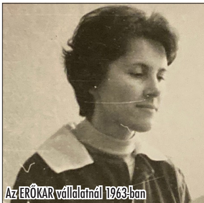
Az ERŐKAR vállalkásánál 1963-ban