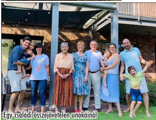
Egy családi összejövetelen unokáinál