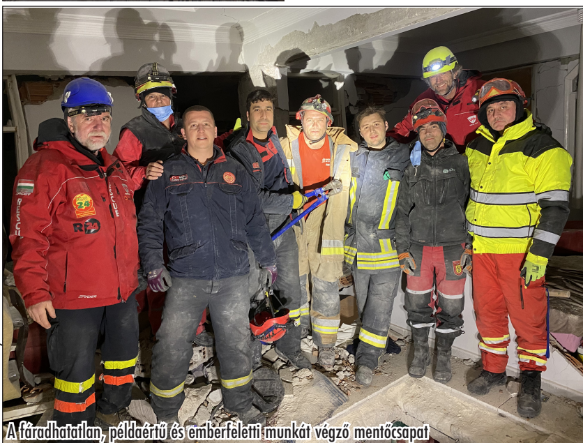
A fáradhatatlan, példaértű és emberfeletti munkát végző mentőcsapat

B. Zs.: A kutyásoknak például nem kell ott lenni, amikor műszaki mentés zajlik, ők akkor tudtak kicsit pihenni. Ugyanígy