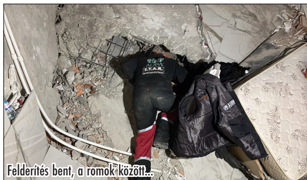
Felderítés bent, a romok között...

B. Zs.: A földrengés után sokan kimenekültek a városból, autókban éjszakáztak. Aztán ahogy szivárogtak vissza az emberek, tüzeket raktak, sátrakat készítettek maguknak. De so-