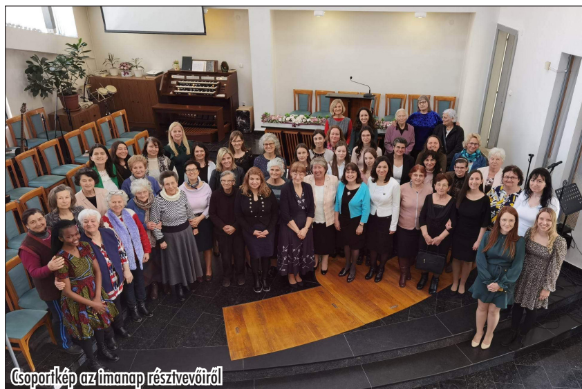
Csoportkép az imanap résztvevőiről