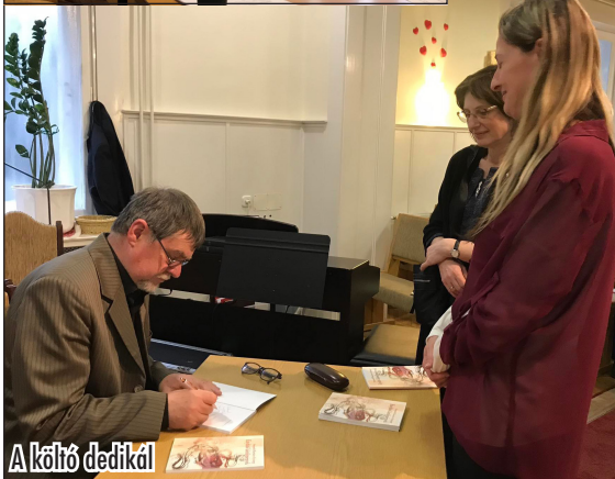
A költő dedikál