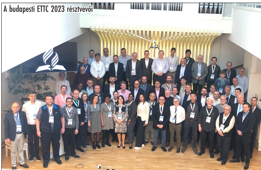
A budapesti ETTC 2023 résztvevői