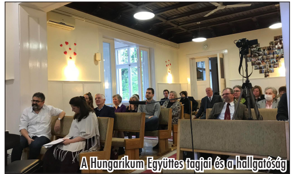
A Hungarikum Egyesület tagjai és a hallgatóság

A költő életébe, a könnyűnek nem nevezhető gyermekkor megismerésébe, az eltelt időben történt irodalmi