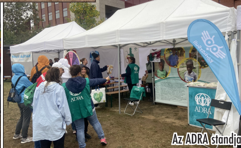
Az ADRA standja