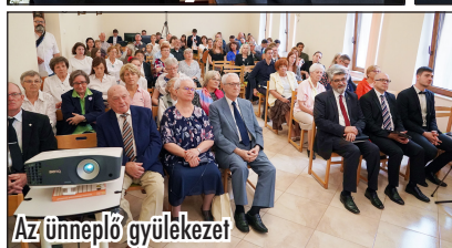
Az ünneplő gyülekezet