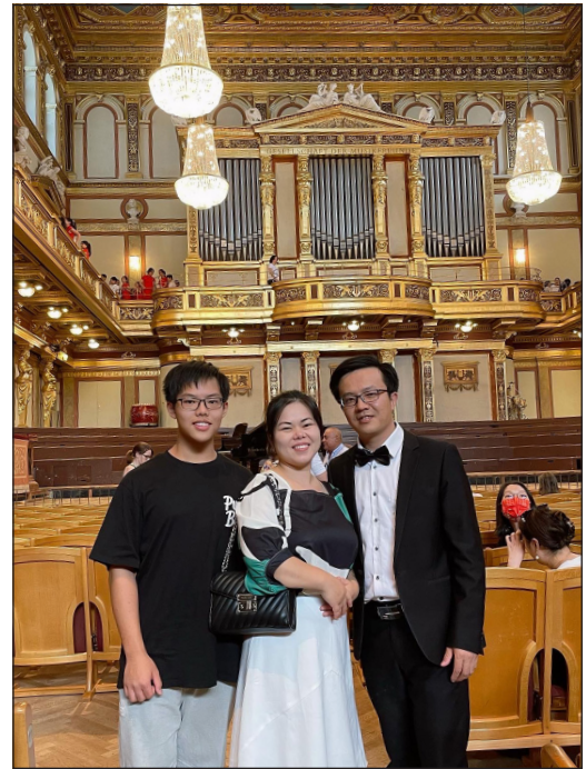
Manian családjával, lelképásztor férjével és fiával

Nagy nehézség a nyelvi akadály. Szeretnék már jobban beszélni magyarul, hogy többet tudjak a magyar testvérnőkkel beszélni, időt tölteni velük és megérteni őket!