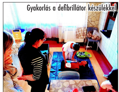
Gyakorlás a defibrillátor készülékkel