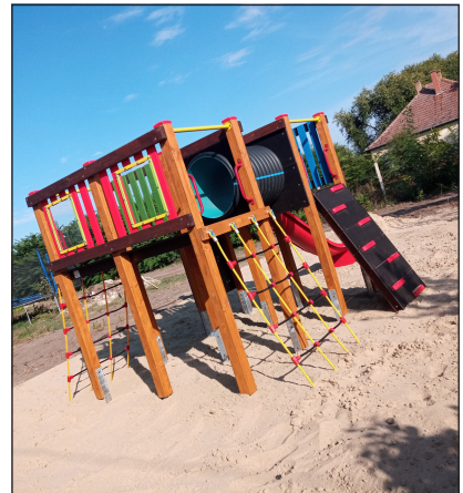
Jelenlét Pont fejlesztése játszóterrel Bojton