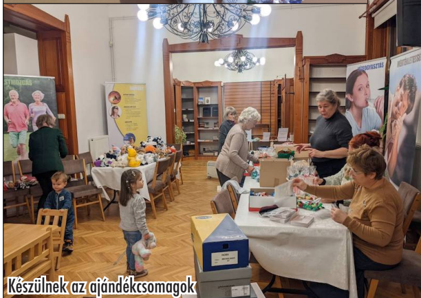
Készülnek az ajándékosomagok

Minden évben más szervezetektől is kapunk támogatást karácsony környékén, de ebben az évben a közel 140 óvodásra és bölcsisre valahogy senki sem gondolt. Az óvoda vezetői elhatározták, sehonnán nem fognak ajándékot kérni, és ha az idén nem lesz meglepetés a gyerekeknek, azt is tudomásul vesszük. Nemsokára csörgött a telefon, és a gyülekezetünkől hívta az egyik testvérnő az önkormányzatot, hogy megbeszéljék az idei évi ajándékok összetételét.