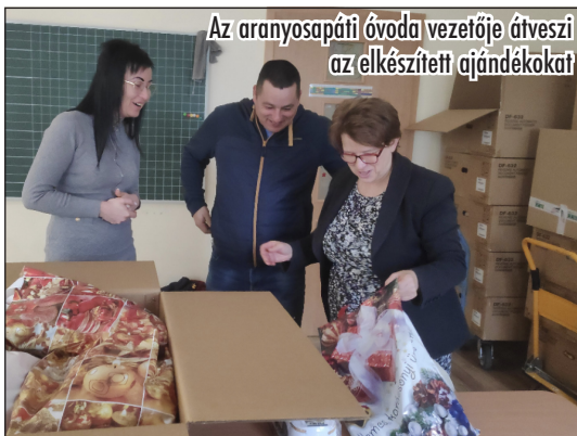
Az aranyosapáti óvoda vezetője átveszi az elkészített ajándékokat

Az Úr azonban elénk hozott egy újabb hátrányos helyzetű települést, Aranyosapátit. Ebben a községben nem tudunk adventista jelenlétről, azonban itt is sok a rászoruló és a halmozottan hátrányos helyzetű család. Az aranyosapátiakat egy online bibliaiskolát végző érdeklődőn keresztül ismertük meg. Ruhával, élelmiszerral, gyermekjátékokkal támogattuk őket az utóbbi években, és jó kapcsolat alakult ki a gyülekezetünk, valamint az aranyosapáti óvoda vezetői és az önkormányzat munkatársai között.