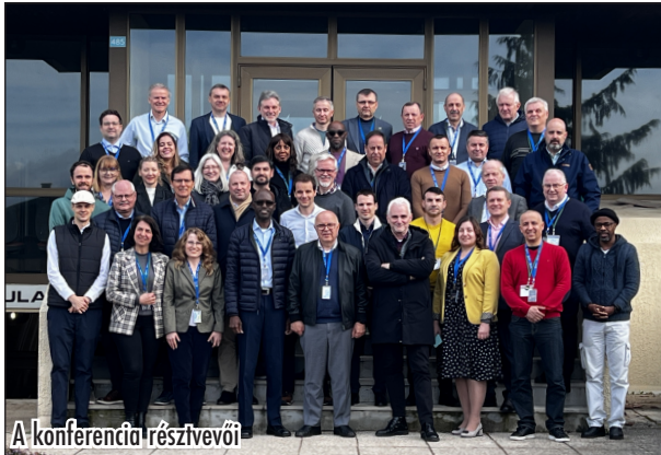
A konferencia résztvevői