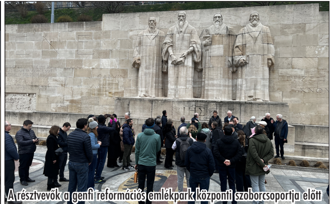
A résztvevők a genfi reformációs emlékpark központi szoborcsoportja előtt