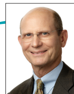
Ted N. C. Wilson, a Hetednap Adventista Egyház elnöke